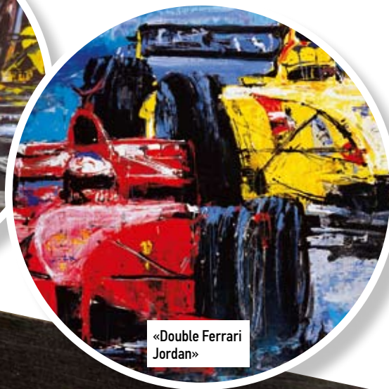
«Double Ferrari Jordan»