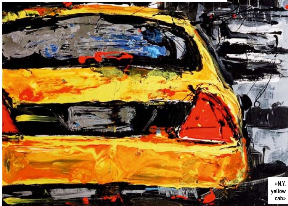
«N.Y. yellow cab»

ΤΟ ΕΡΓΟ ΤΗΣ «THE DOWNHILL SKIER» ΕΠΕΛΕΓΗ ΩΣ ΕΠΙΣΗΜΗ ΑΦΙΣΑ ΤΩΝ ΧΕΙΜΕΡΙΝΩΝ ΟΛΥΜΠΙΑΚΩΝ ΑΓΩΝΩΝ ΤΟΥ ΣΟΛΤ ΛΕΪΚ ΣΙΤΙ ΣΤΙΣ ΗΠΑ.